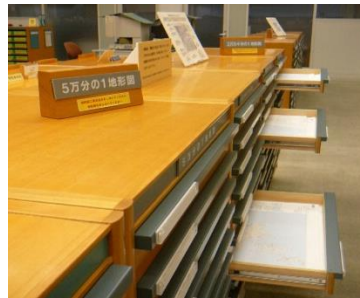
2階・地形図が入っている棚

例えば2万5千分の1地形図では、岐阜県内の地域でも、地勢図名は「金沢」「高山」「岐阜」「飯田」「名古屋」「豊橋」と、6つに分かれているので気をつけましょう。