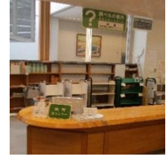
2階 地図カウンター

地形図とは、正確な測量をもとにして山や川などの地形（地表の起伏状態など）を地図記号や等高線などで詳細に表した地図です。調べ学習や旅行、登山などに活用できます。